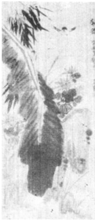
(国画) 秋韵 李复圣