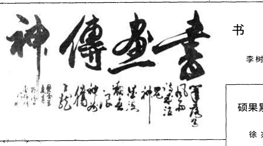
书 法 李树柯 硕果累累 徐兆鹏